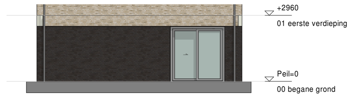
Achtergevel 1 : 100 Optie: - Schuifpui